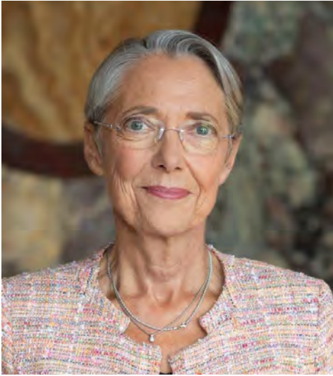
Élisabeth Borne Première ministre

« Le combat continuera jusqu'à ce que l'égalité ne pose plus de questions. »