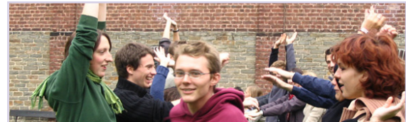
Exemple de projet financé : la formation internationale des étudiants

Pays membres de l'Union européenne éligibles aux programmes d'action communautaire